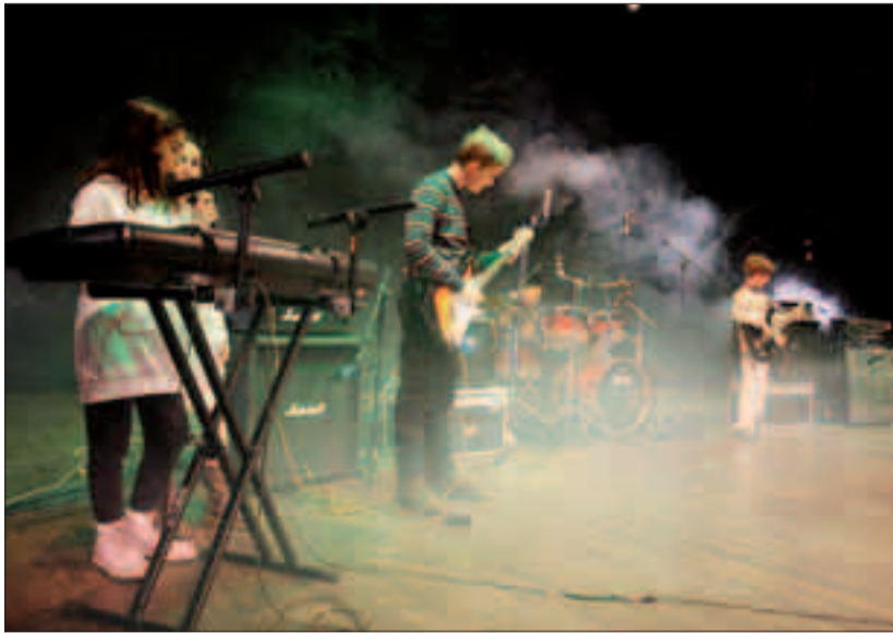
Rock a Padergnone con Forza Band, lo scorso anno. In alto a destra una delle immagini simbolo del terremoto in Abruzzo